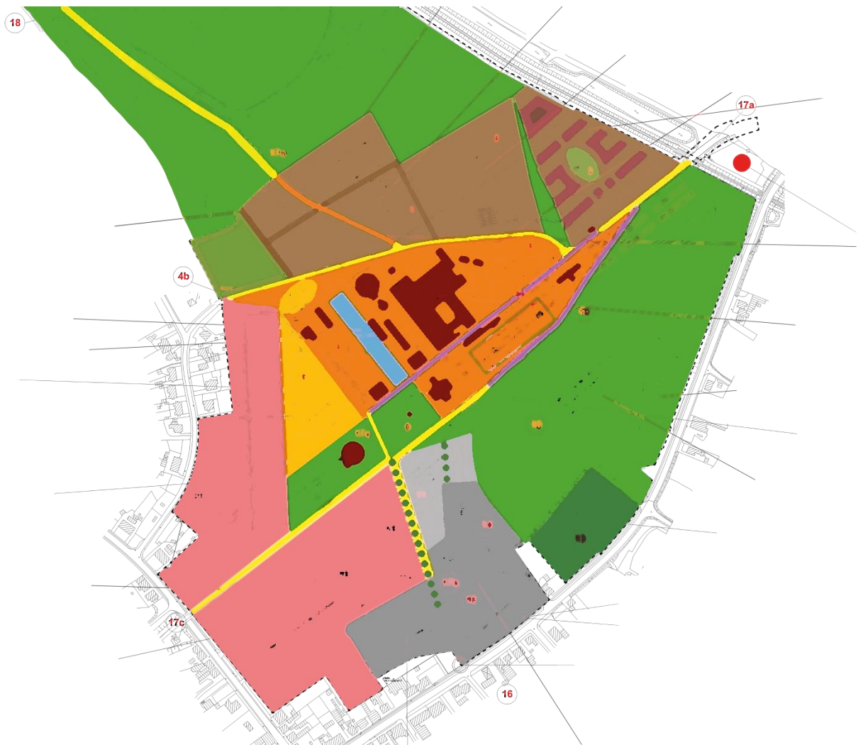
Lageplan des ehemaligen Zechengeländes Heinrich Robert in Hamm.