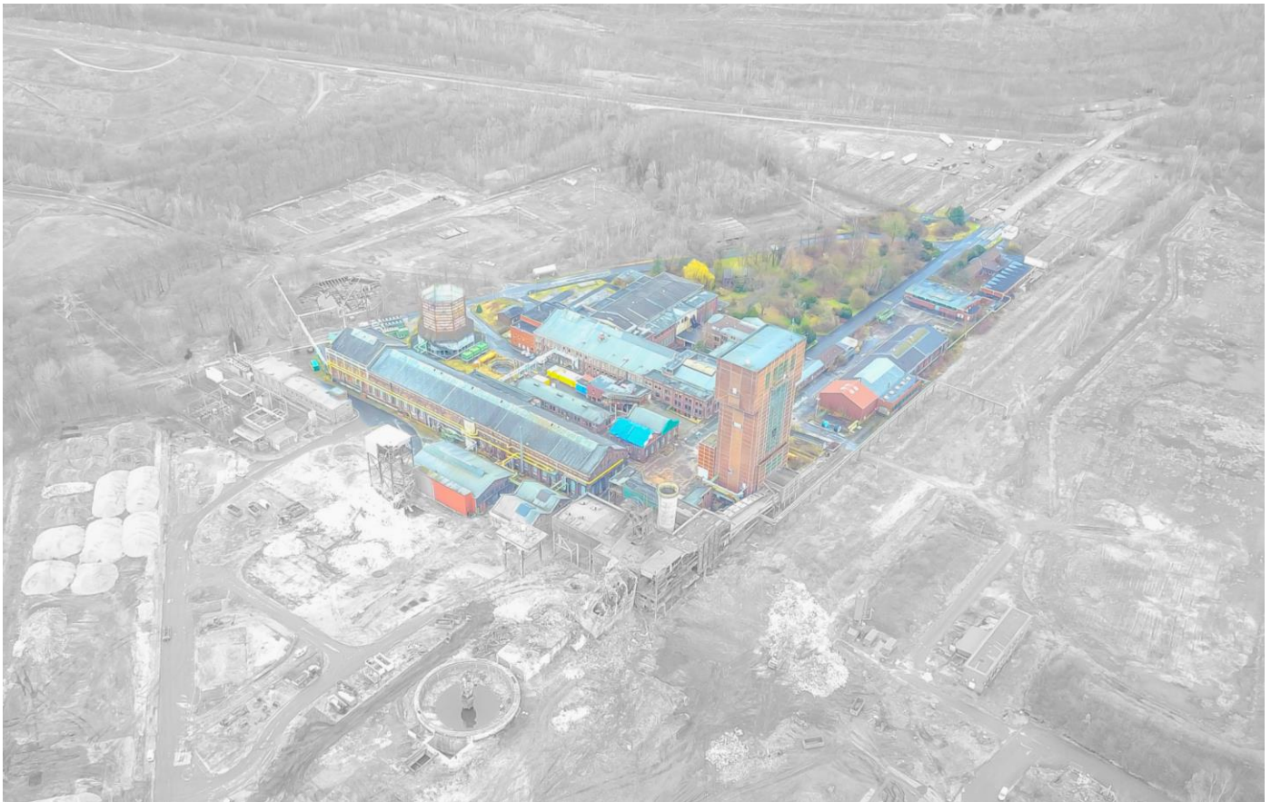
Das Herzstück des CreativReviere Heinrich Robert liegt inmitten des 55 Hektar-großen Areals: Das altindustrielle Gebäudeensemble.